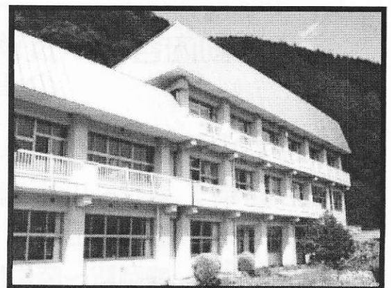
【かわいキャンプ外観】