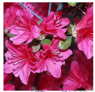
岩手県上閉伊郡大槌町 シンボル新山つつじ